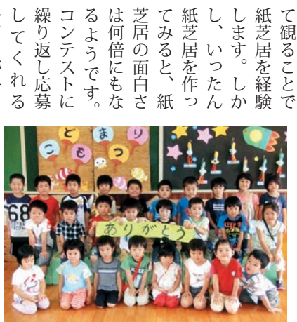
被災地の幼稚園から届いたお礼

て観ることで紙芝居を経験します。しかし、いったん紙芝居を作ってみると、紙芝居の面白さは何倍にもなるようです。コンテストに繰り返し応募してくる子どもが多くいることが、このことを物語っています。作ると今度は、誰かに観てもらいたくなります。「演じて」と大人に差し出す子、自分で演じてみたくなる子もいます。紙芝居は、心の底にある思いを絵とお話で表現し、演じることで伝えるという、複数の表現手段をもっているコミュニケーションツールです。保育の中で、お家で、子どもと一緒に紙芝居を作って演じてみてください。きっと、子どものいろいろな思いに気づかされることでしょう。