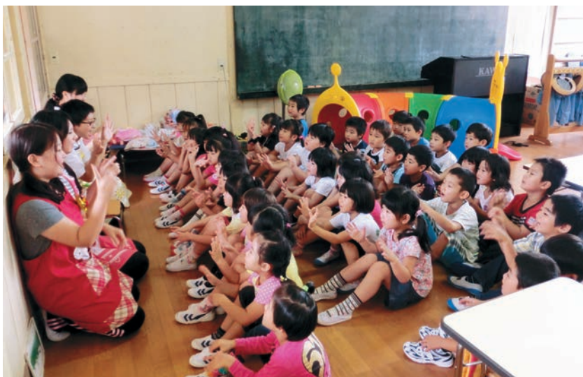
ふじ幼稚園仮園舎にて