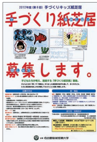
お問い合わせは図書館へ