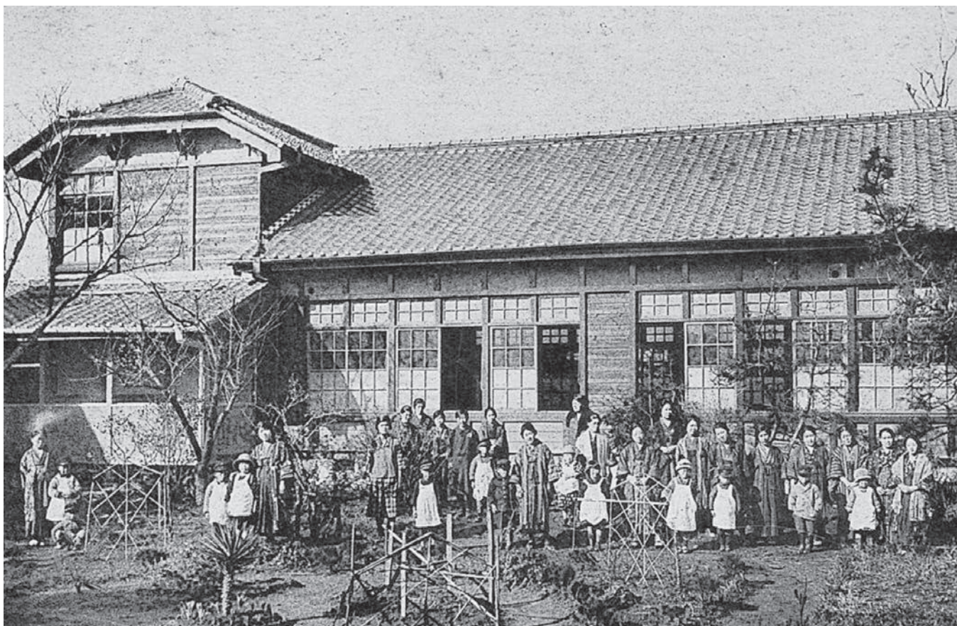
柳城幼稚園・保母養成所