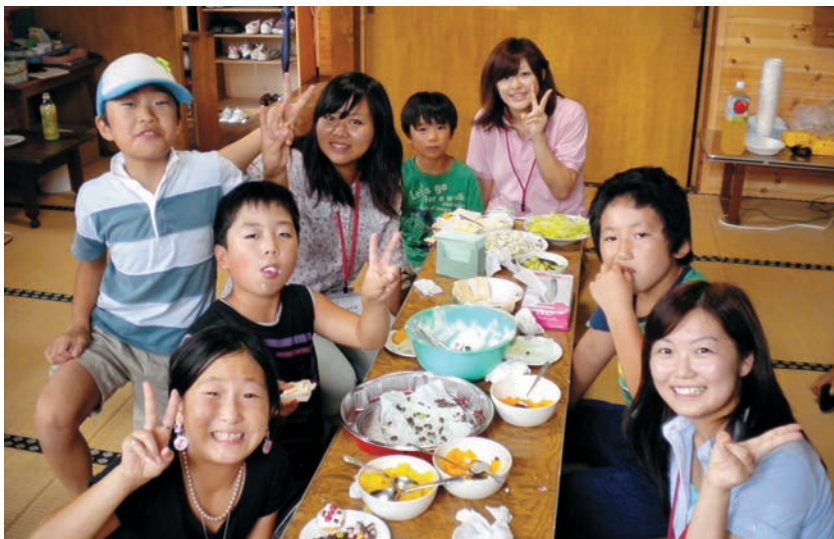
室根子ども会活動

多くのことを学ばされました。昨年の創立記念礼拝では報告会を催し、18名の学生が皆発言し大学全体での活動から得たものを分かち合ったことは意義深いことでした。多くの困難と悲しみのなかにある方々を覚え、私たちが祈り続けることが求められていることを教えられました。(詳しい内容は、学生の感想文とともに「報告書」が発行されています。)