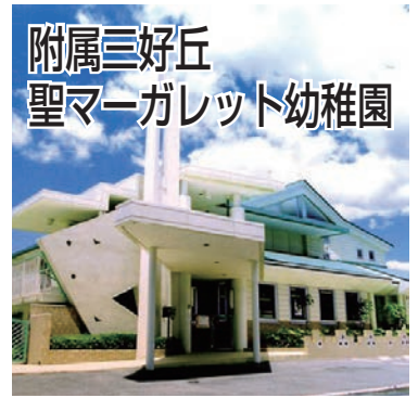
附属三好丘 聖マーガレット幼稚園

して充分遊び、「安全でおいしい給食」をお腹いっぱい食べる。こんな園生活が生きる力につながると思っています。続いてその活動の様子をお伝えします。